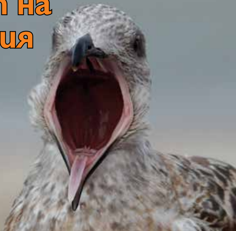
Чайка с отворена човка, в близост до остров Силт.