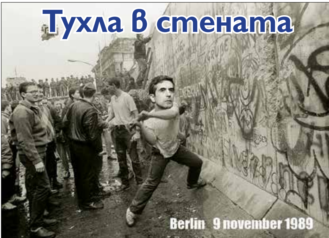
Berlin 9 november 1989