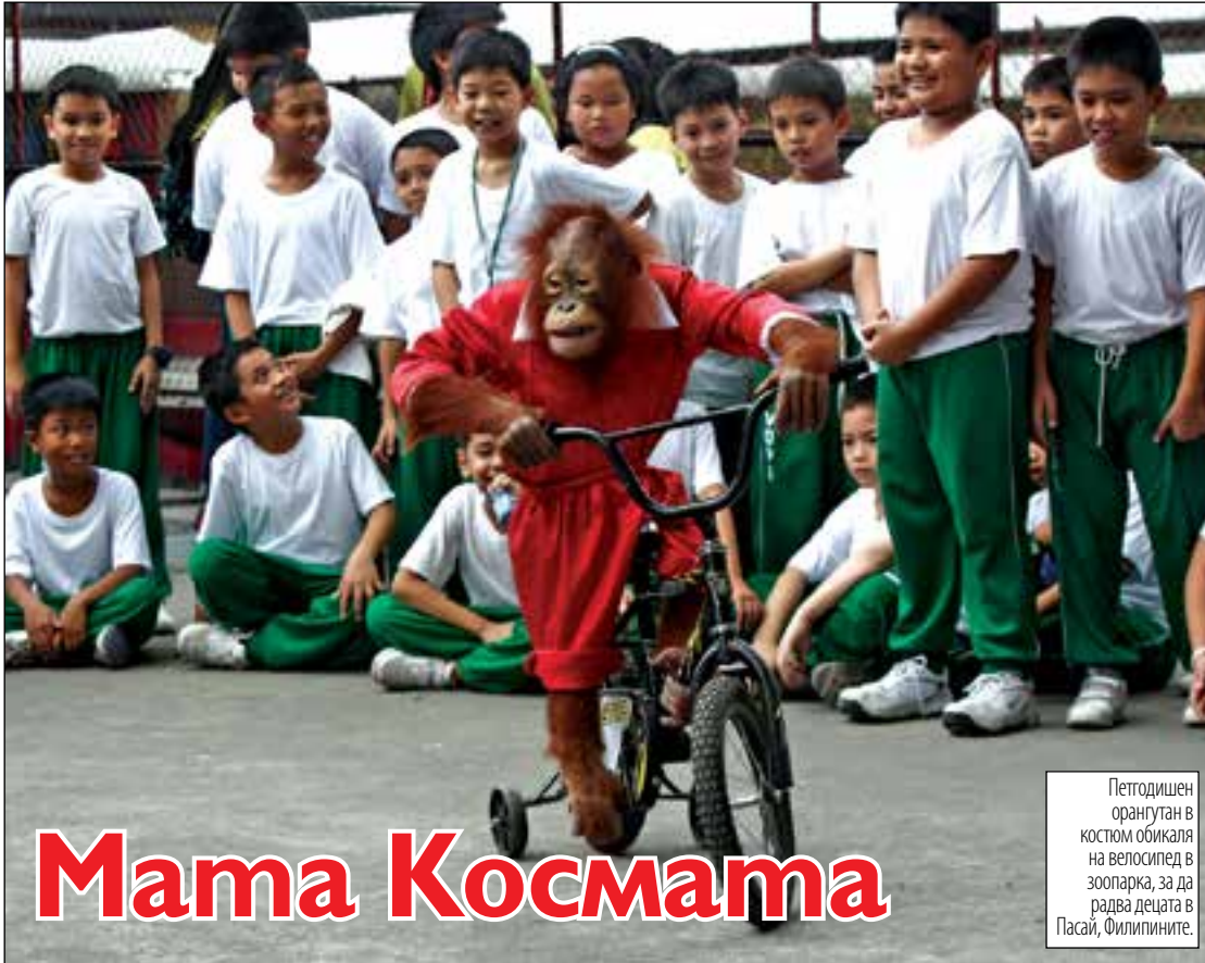
Петгодишен орангутан в костюм обикаля на велосипед в зоопарка, за да радва децата в Пасай, Филипините.