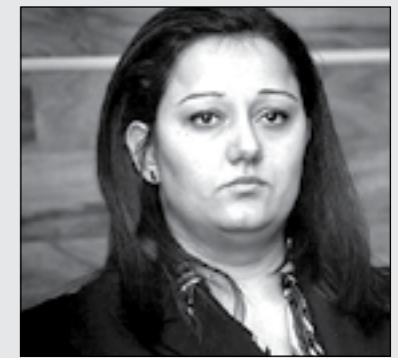
лв. за изграждане на 125 центъра от семеен тип и 33 защитени къщи за близо 2 000 деца.

От 2015 г. започва изграждането на центрове от семеен тип за възрастни хора във Варна, съобщи министърът на регионалното развитие Лиляна Павлова. Тя уточни, че процесът ще тече по аналогия с деинституализирането на децата от социалните домове в страната. Според Павлова през новия програмен период за изграждане на различен тип жилища в страната ще бъдат заделени 200 млн. лв. Регионалният министър припомни, че при предишния мандат на кабинета Борисов бяха осигурени 105 млн.