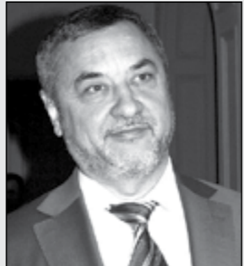
управител на София-град бяха назначени тази седмица по същата линия и са видни дейци на ислямистката партия.

беше официално подкрепен от него и 1 милион листовки със снимки от тяхната среща се разсипаха като позиви из България. НПСД водеше и последната си кампания като част от РБ на турски език. Освен проява на лош вкус, това е и незаконно според правните норми в Република България, чието незначително е стил на Касим Дал повече от 30 години. Добавяме, че шефката на кабинета в МОН и областният