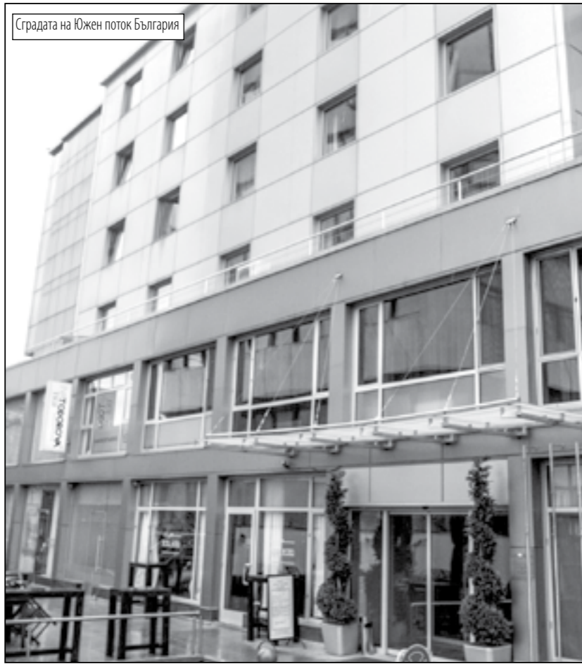
Сградата на Южен поток България

Напомняме, че в началото на юни при посещение на американския сенатор Кейн президентът на страната ни Росен Плевнелиев и премиерът тогава Пламен Орешарски замразиха проекта за газопровод през родината. ЕС тогава подкрепи тази