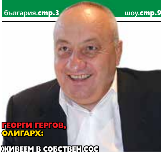
ГЕОРГИ ГЕРГОВ, ОЛИГАРХ: