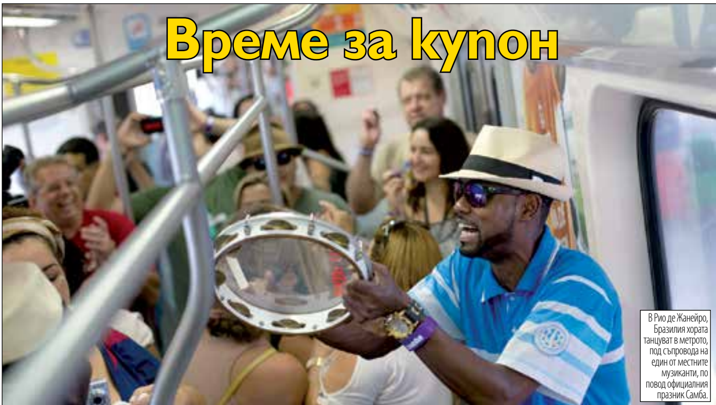
В Рио де Жанейро, Бразилия хората танцуват в метрото, под съпровода на един от местните музиканти, по повод официалния празник Самба.