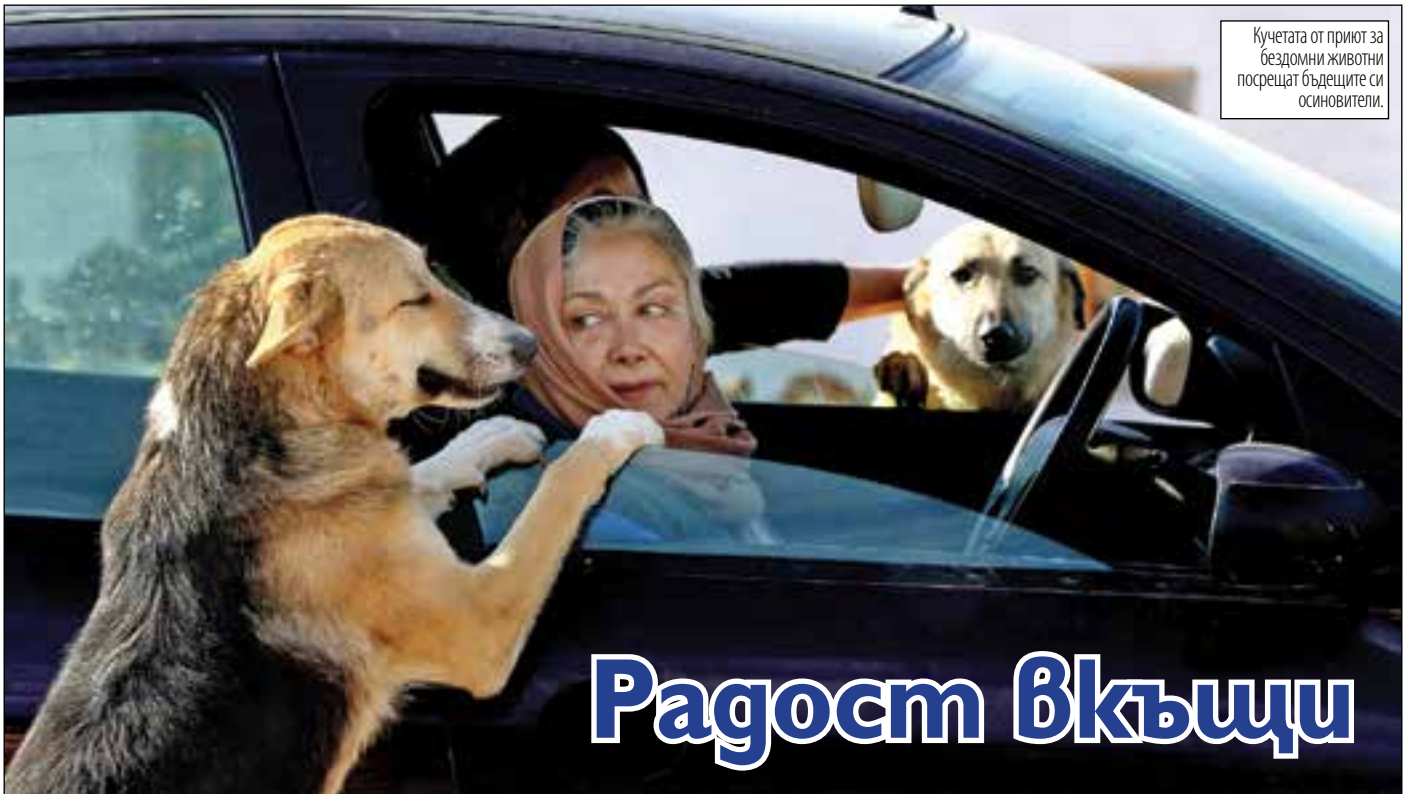
Кучетата от приют за бездомни животни посрещат бъдещите си осиновители.