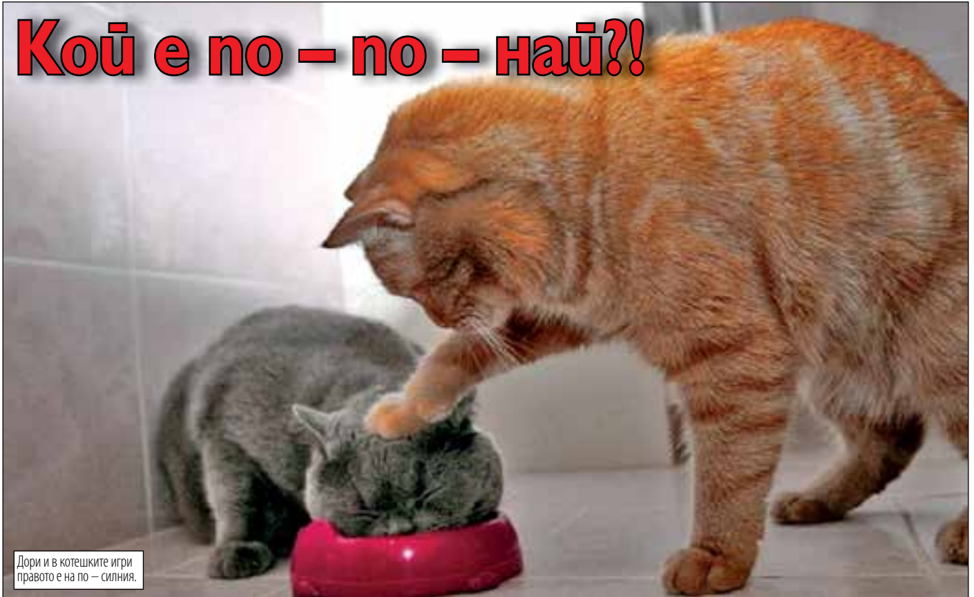
Дори и в котешките игри правото е на по – силния.