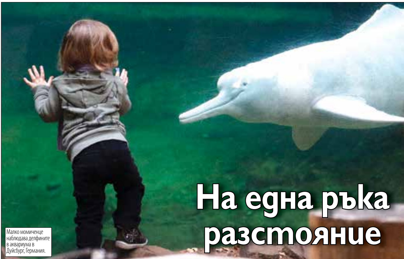
Малко момиченце наблюдава делфините в аквариума в Дуйсбург, Германия.