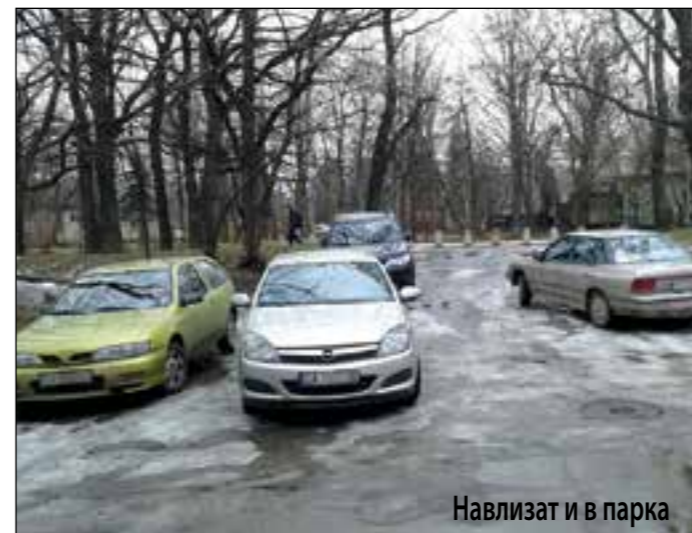
Навлизат и в парка

Голямо веселие предизвикаха в нас някои лимузини – новички, за над 150 000 лева, които също са се настанили на безплатното. Очевидно е явно, че бедността не се мери в пари, а в други величини.