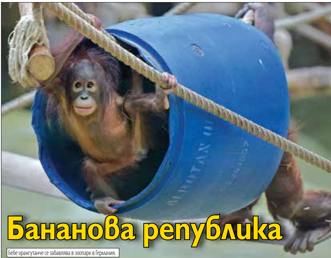
Бебе орангутанче се забавлява в зоопарк в Германия.