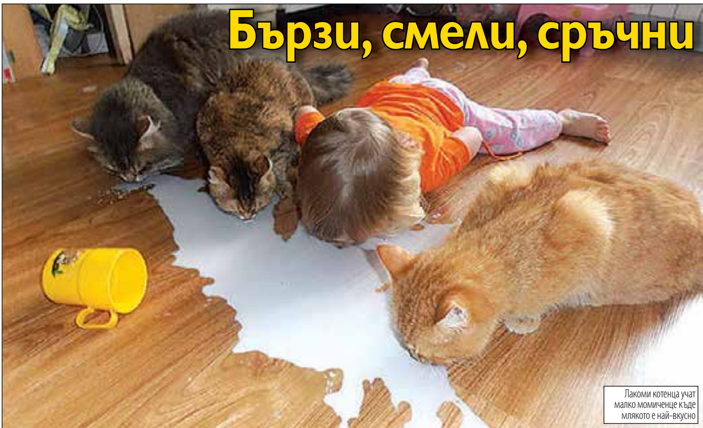
Лакоми котенца учат малко момиченце къде млякото е най-вкусно