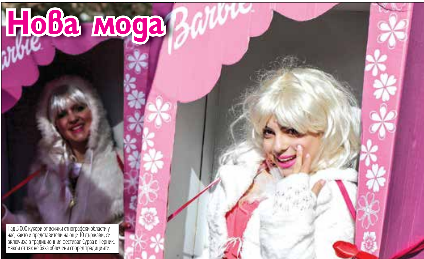
Над 5 000 кукери от всички етнографски области у нас, както и представители на още 10 държави, се включиха в традиционния фестивал Сурва в Перник. Някои от тях не бяха облечени според традициите.