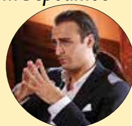
Бербо е убедителен лидер в анкетата, като е събрал повече от 45%.