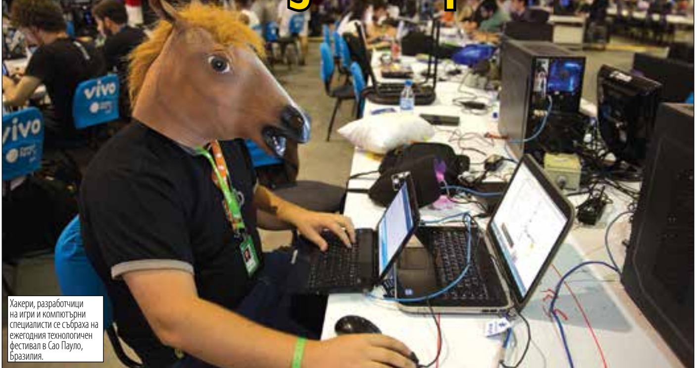
Хакери, разработчици на игри и компютърни специалисти се събраха на ежегодния технологичен фестивал в Сао Пауло, Бразилия.