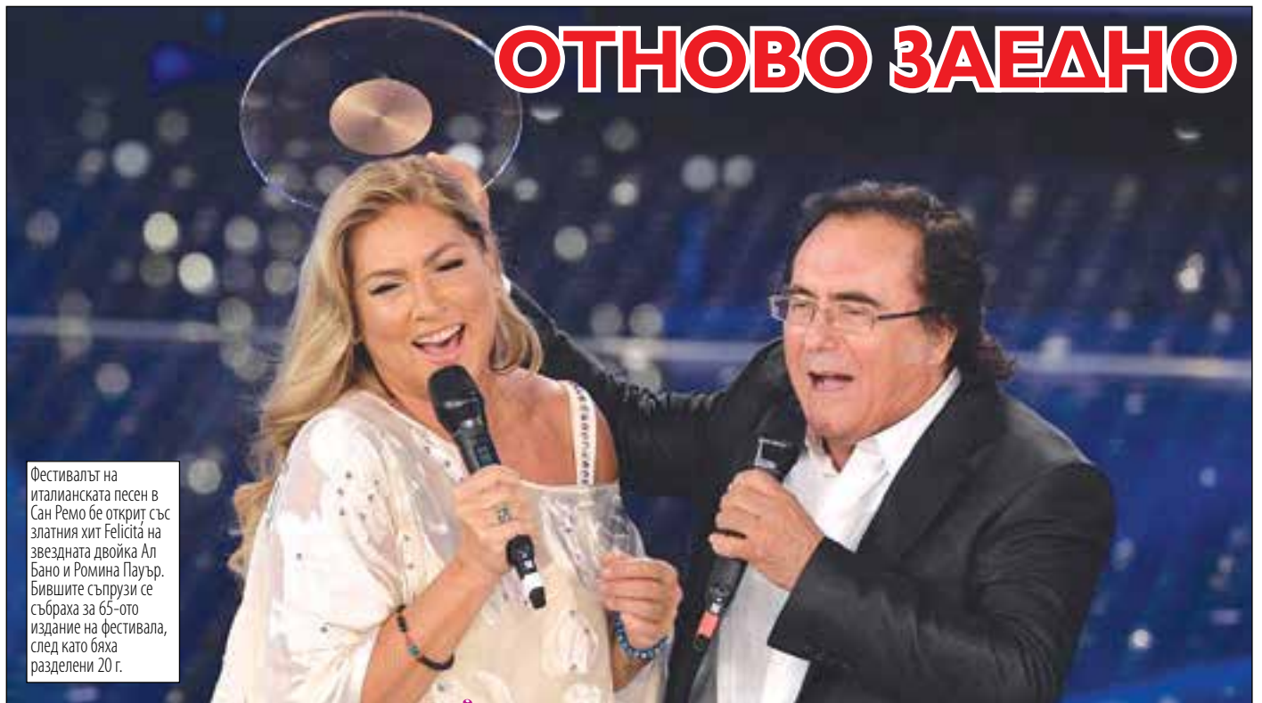
Фестивалът на италианската песен в Сан Ремо бе открит със златния хит Felicità на звездната двойка Ал Бано и Ромина Пауър. Бившите съпрузи се събраха за 65-ото издание на фестивала, след като бяха разделени 20 г.