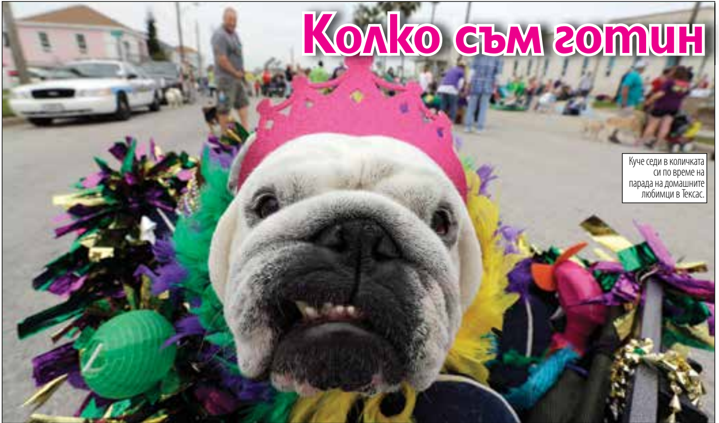
Куче седи в количката си по време на парада на домашните любимци в Тексас.