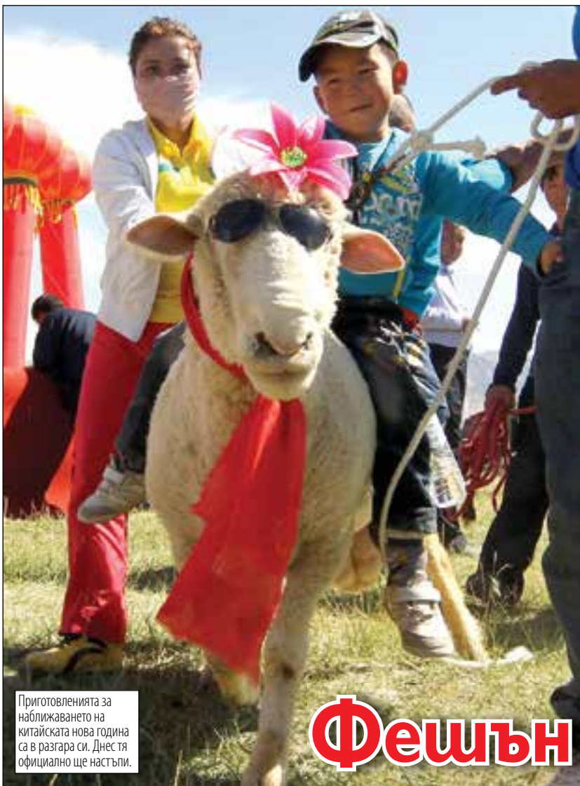
Пригответеленията за приближаването на китайската нова година са в разгара си. Днес тя официално ще настъпи.