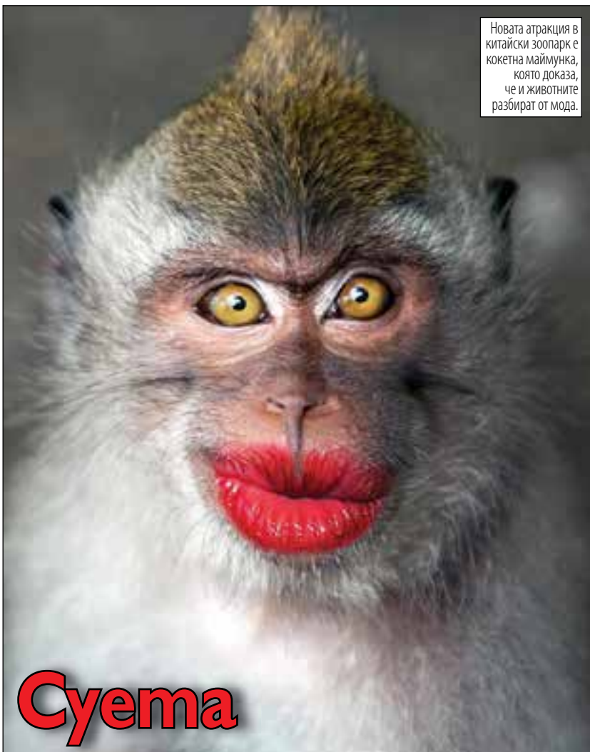
Новата атракция в китайски зоопарк е кокетна маймунка, която доказва, че и животните разбират от мода.