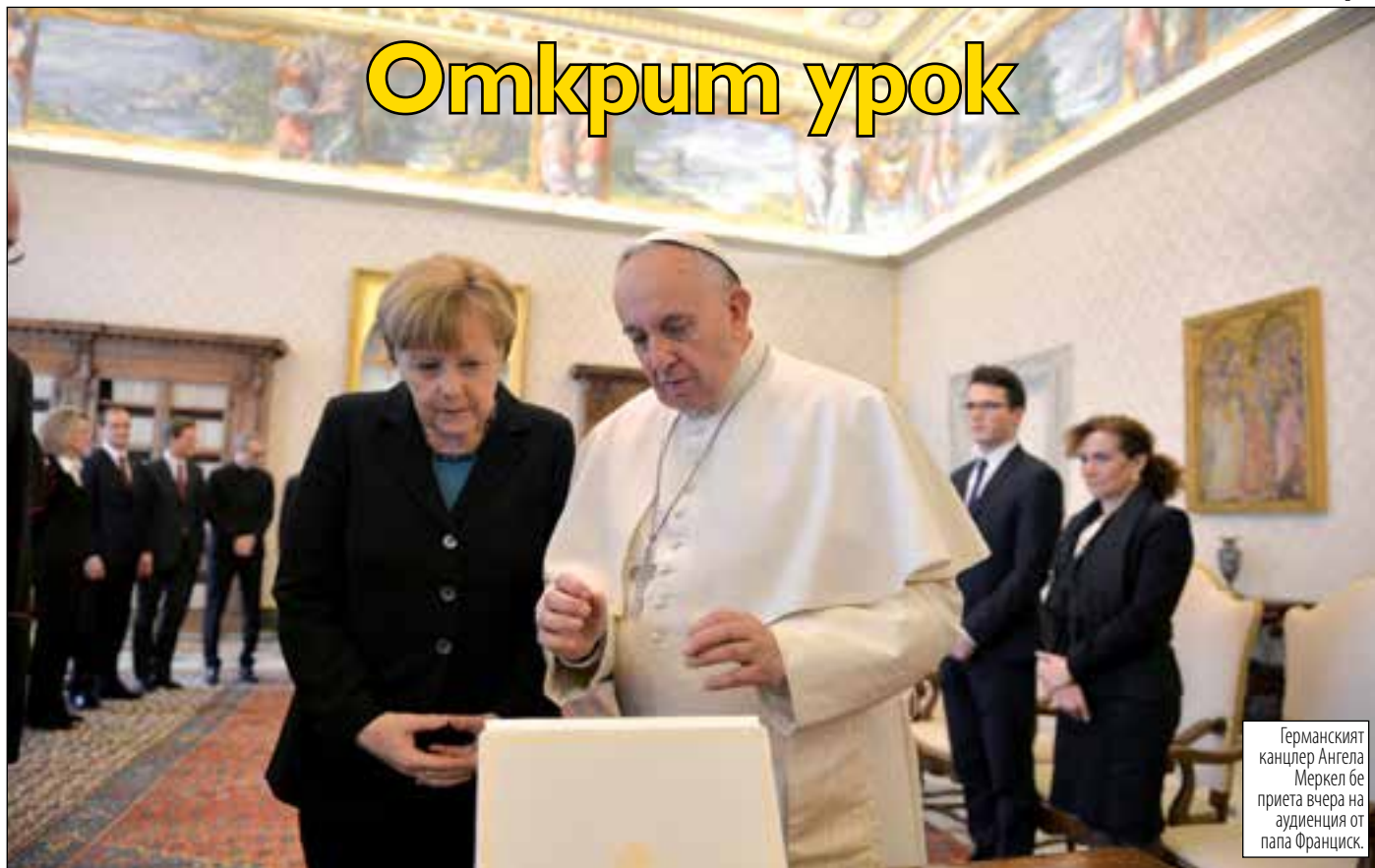
Германският канцлер Ангела Меркел бе приета вчера на аудиенция от папа Франциск.