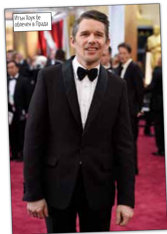
Итън Хоук бе облечен в Прада