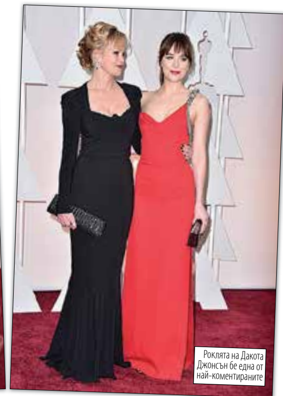
Роклята на Дакота Джонсън бе една от най-коментираниите