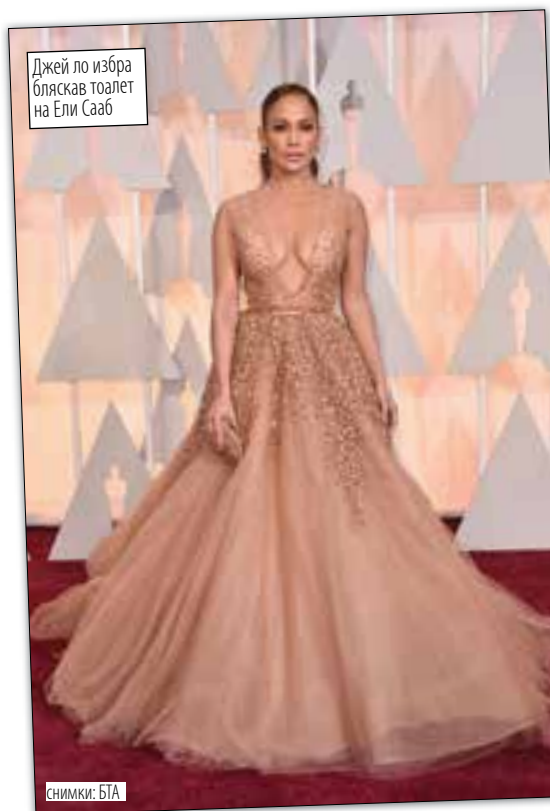
Джей Ло избра блестящ тоалет на Ели Сааб

Диамантеното е цвят, дантелата е хит, френската мода дестронира италианската като властелин на Оскарите след дълги години. Това показва разходката на най-добре облечените кинозвезди по червения килим. И като говорим за алено, най-коментираниите рокли на вечерта вероятно бяха тези на Дакота Джонсън от 50 нюанса сиво, довели майка си Мелани Грифит в черно с испанско правоъгълно деколте, както и на Розамунд Пайк с нейната секси дантела. И двете дами бяха облечени от френски модни къщи - съответно Сен Лоран и Живанши. Другият основен тренд - диамантеното като цвят, направи изумителен имиджа на други две от централните дами на вечерта - новата Мерил Стрийп - Джулиън Муур и Марион Котийар. И те двете във френска мода - съответно Шанел и