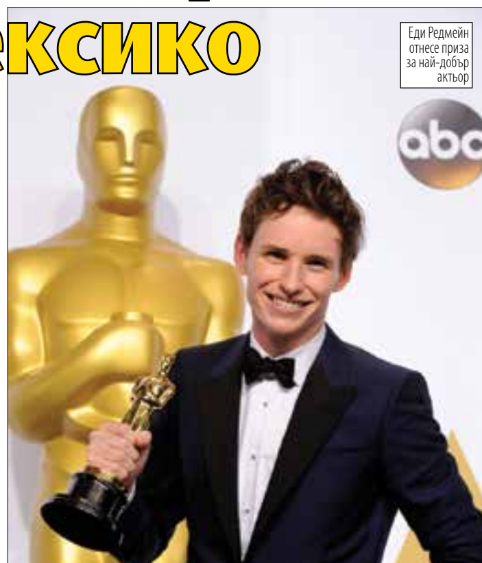
Еди Редмейн отнесе приза за най-добър актьор