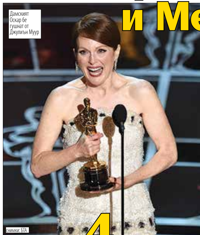
Дамският Оскар бе гушнат от Джулиън Муур