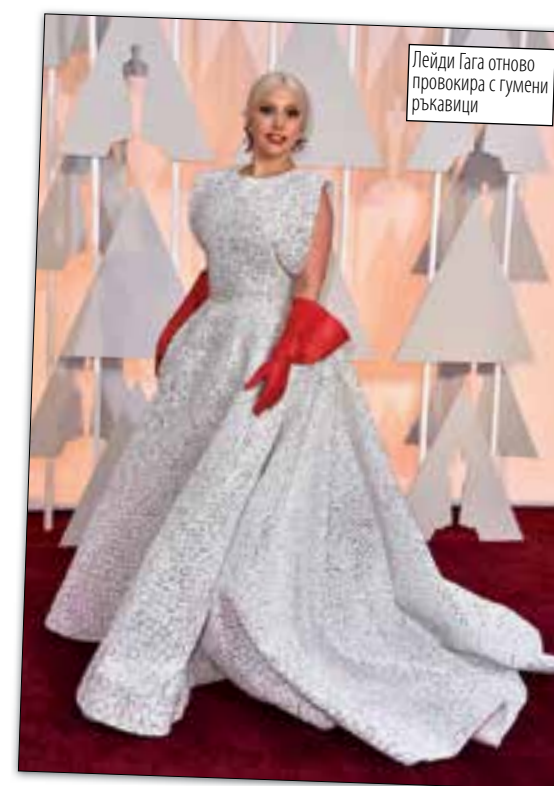
Лейди Гага отново провокира с гумени ръкавици

Каролина Куркова в Маркеза. Нашите уважения за Майкъл Киттън, който се завърна със стил, макар без лъскавата си врана коса, в голямата игра на киноиндустрията.