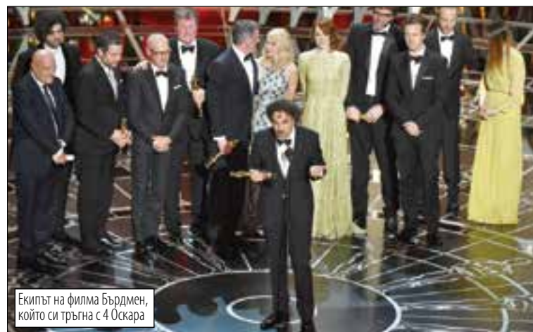
Екипът на филма Бърдмен, който си тръгна с 4 Оскара

танеца Еди Редмейн, който би сънародника си Бенедикт Къмбърбач, най-известен като Шерлок. Дамският Оскар бе гушнат от Джулиън Муур, наричана вече новата Мерил Стрийп след 4 номинации. За роля на бола от Ацхахаймер. И след наградата за женска роля на последния фестивал в Кан за друг филм. Тя прояви уникална за такъв момент самоирония и каза: „Казват, че Оскарът подмладявал с 5 години - дано, защото мъжът ми е по-млад от мен“. Най-добрата поддържаща роля е на Патриция Аркет. Полският филм Ида пък е най-добър чуждоезичен.