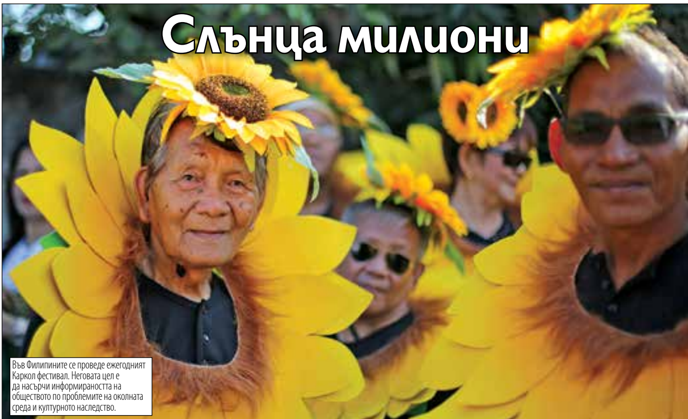
Във Филипините се провежда ежегодният Каркол фестивал. Неговата цел е да насърчи информираността на обществото по проблемите на околната среда и културното наследство.