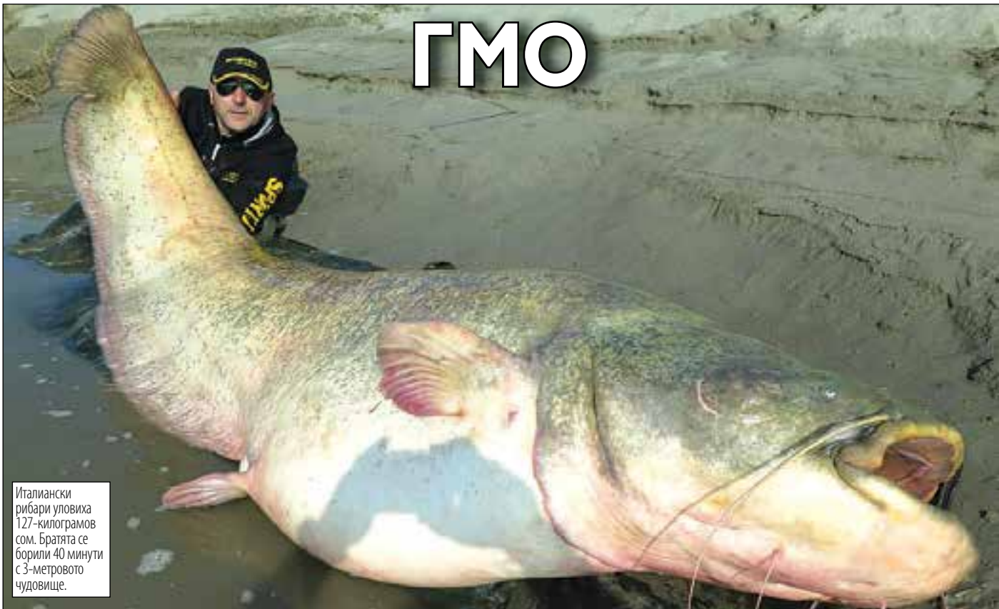
Италиански рибари уловиха 127-килограмов сом. Братята се борили 40 минути с 3-метровото чудовище.