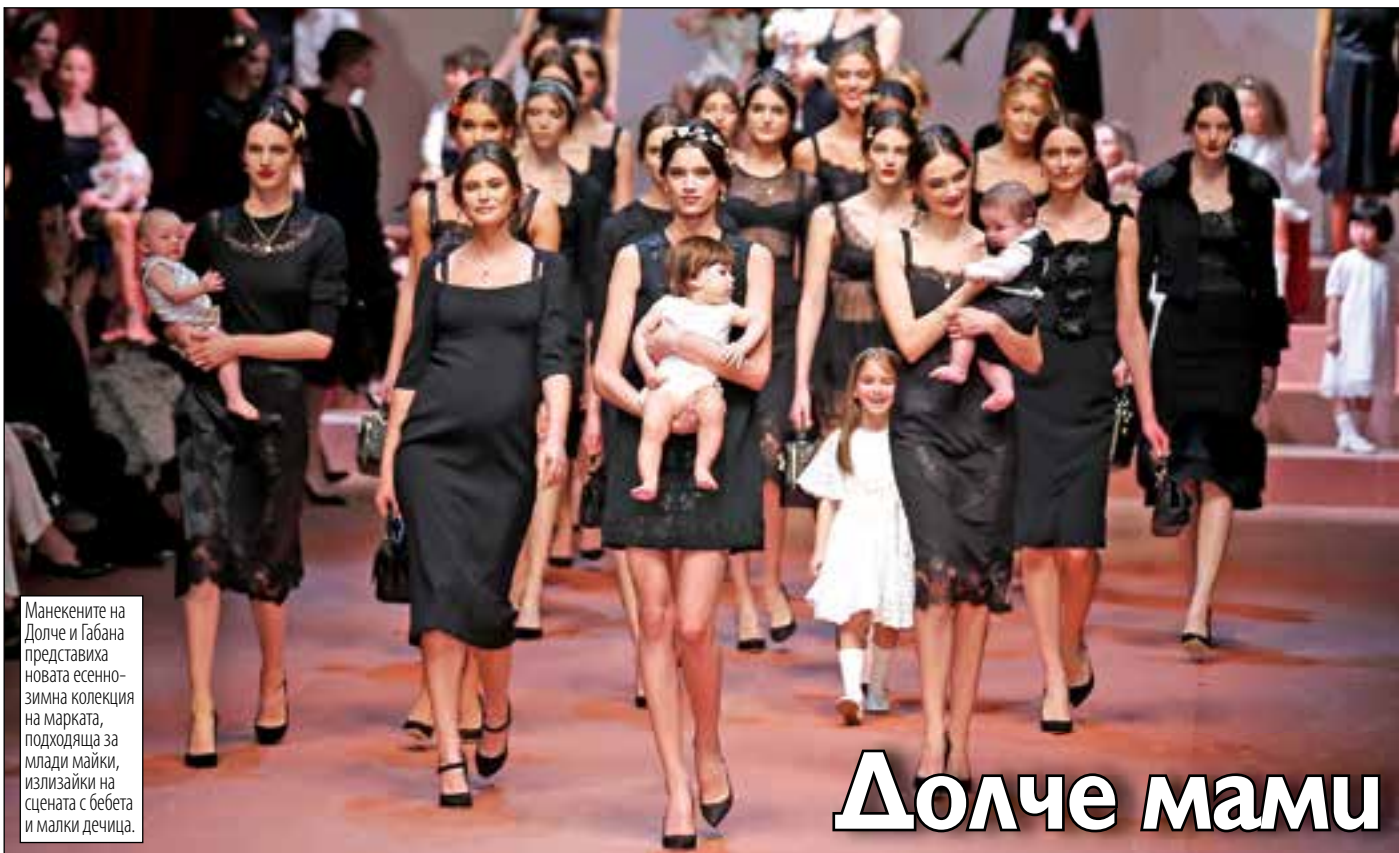
Манекените на Долче и Габана представиха новата есенно-зимна колекция на марката, подходяща за млади майки, излизайки на сцената с бебета и малки дечица.