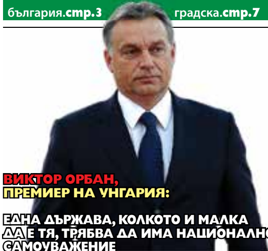
ВИКТОР ОРБАН, ПРЕМИЕР НА УНГАРИЯ:

ЕДНА ДЪРЖАВА, КОЛКОТО И МАЛКА ДА Е ТЯ, ТРЯБВА ДА ИМА НАЦИОНАЛНО САМОУВАЖЕНИЕ