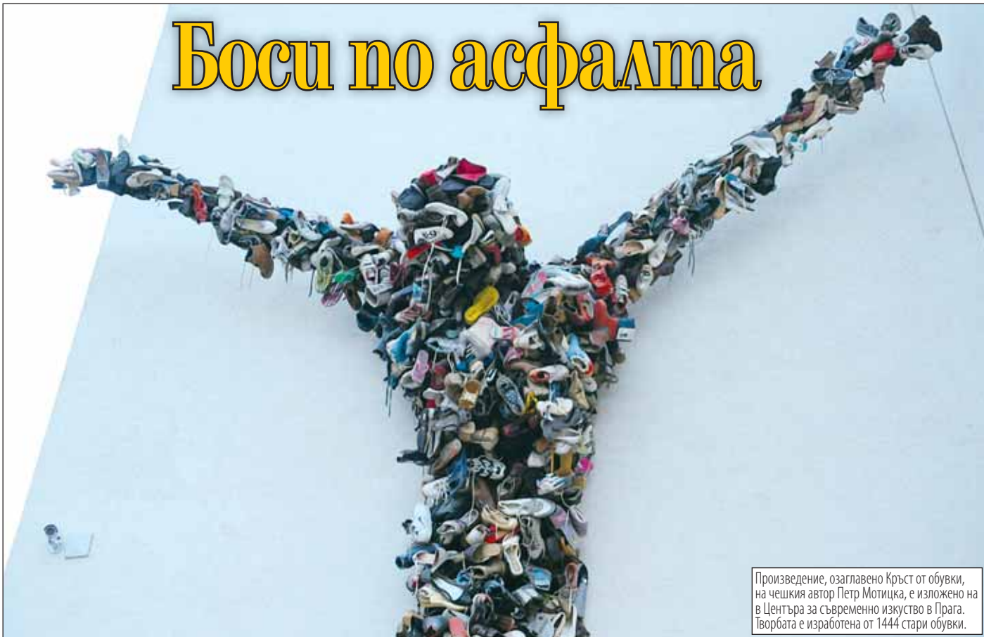
Произведение, озаглавено Кръст от обувки, на чешкия автор Петр Мотицка, е изложено на в Центъра за съвременно изкуство в Прага. Творбата е изработена от 1444 стари обувки.