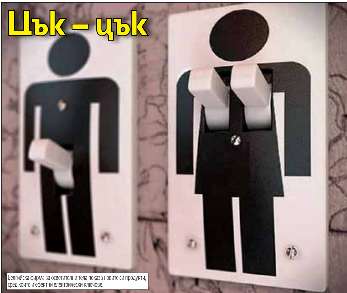
Белгийска фирма за осветителни тела показва новите си продукти, сред които и ефектни електрически ключове.