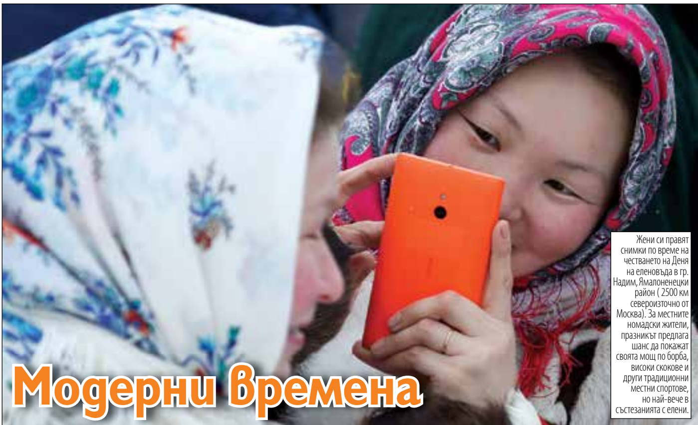
Жени си правят снимки по време на честването на Деня на еленовъда в гр. Надим, Ямалоненецки район (2500 км североизточно от Москва). За местните номадски жители, празникът предлага шанс да покажат своята мощ по борба, високи скокове и други традиционни местни спортове, но най-вече в състезанията с елени.