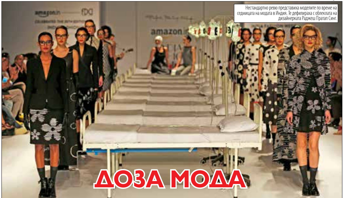
Нестандартно ревю представиха моделите по време на седмицата на модата в Индия. Те дефилираха с облеклата на дизайнерката Раджеш Пратап Синг.