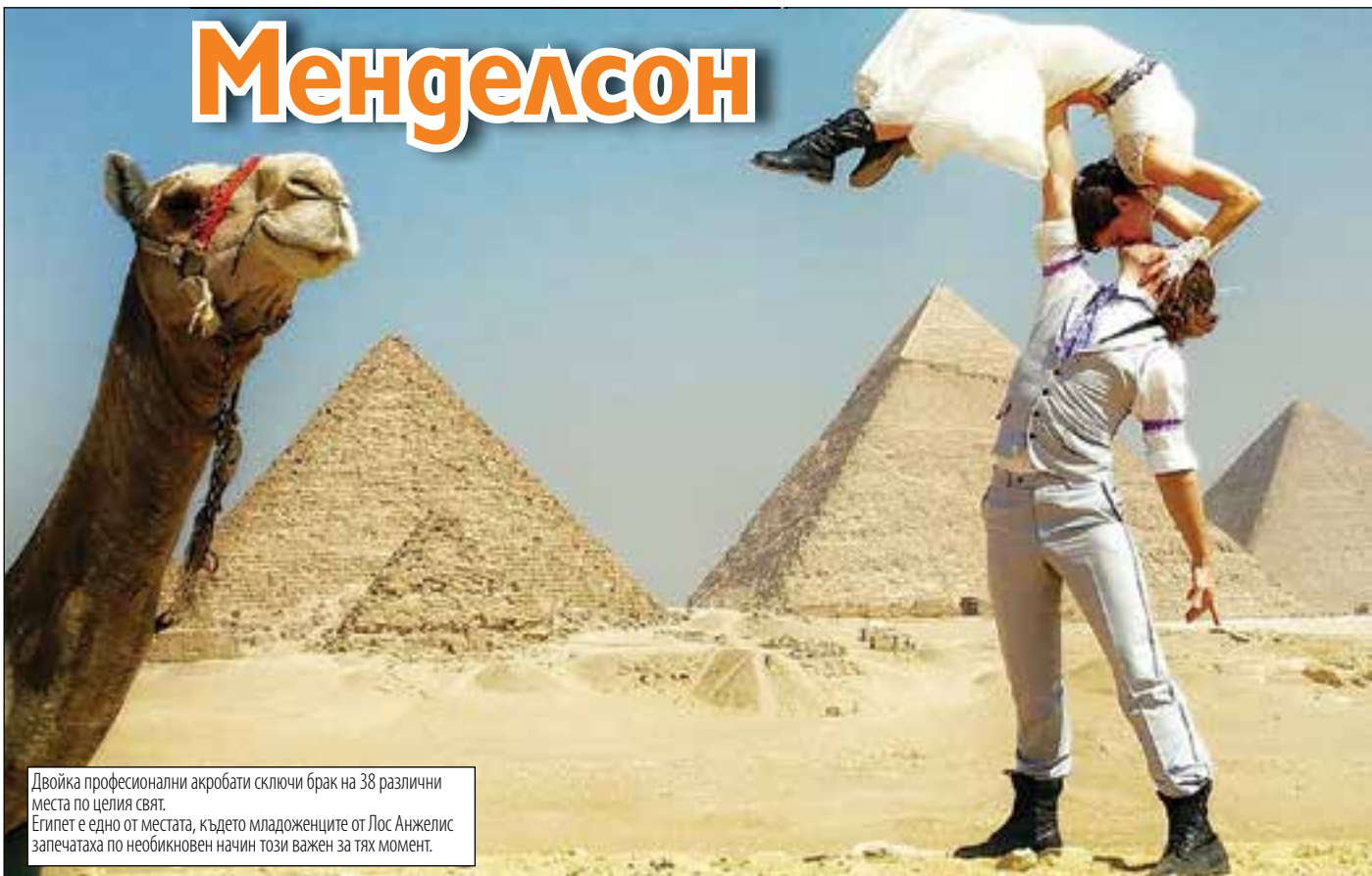
Двойка професионални акробати сключи брак на 38 различни места по целия свят. Египет е едно от местата, където младоженците от Лос Анжелис запечатаха по необикновен начин този важен за тях момент.