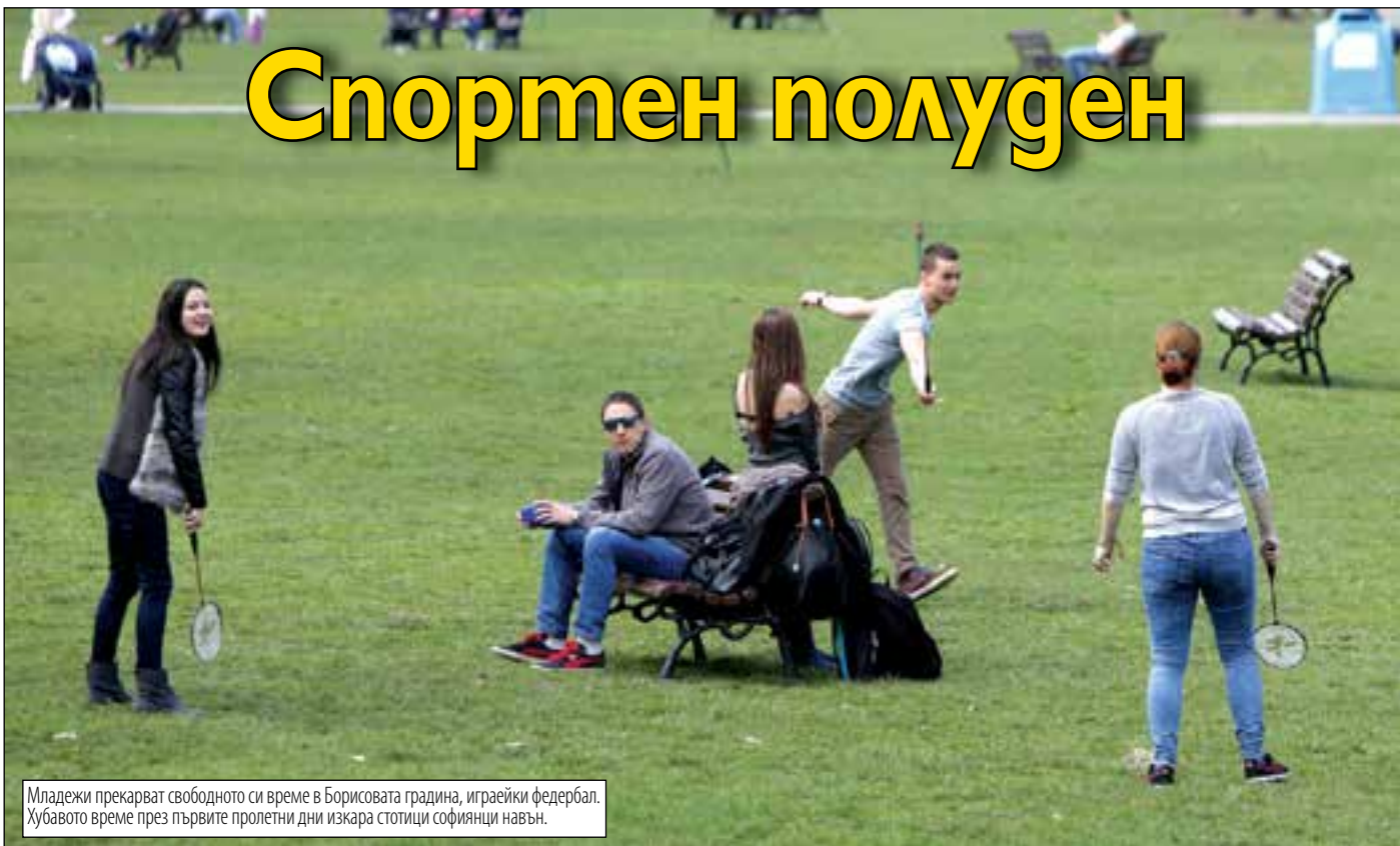
Младежи прекарват свободното си време в Борисовата градина, играейки федербал. Хубавото време през първите пролетни дни изкара стотици софиянци навън.