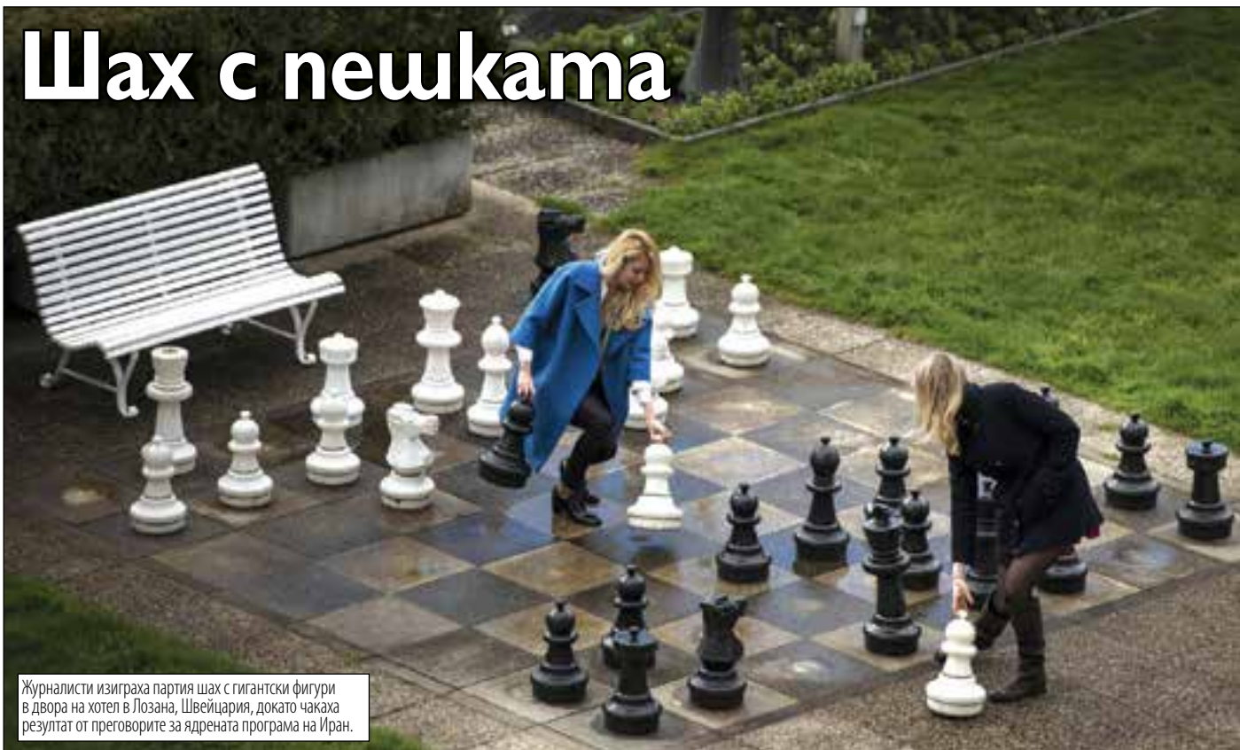
Журналисти изиграха партия шах с гигантски фигури в двора на хотел в Лозана, Швейцария, докато чакаха резултат от преговорите за ядрената програма на Иран.