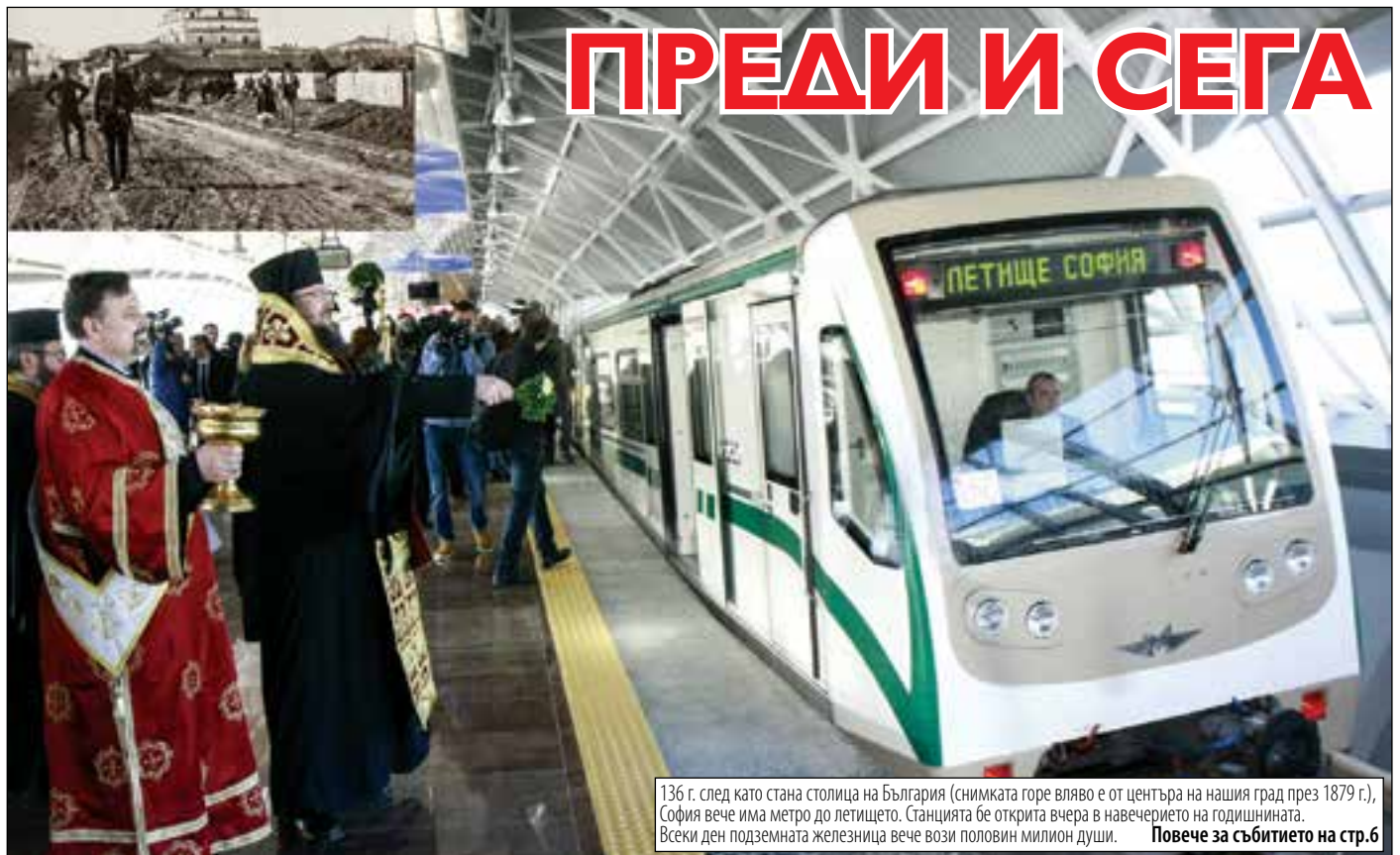
136 г. след като стана столица на България (снимката горе вляво е от центъра на нашия град през 1879 г.), София вече има метро до летището. Станцията бе открита вчера в навечерието на годишнината. Всеки ден подземната железница вече вози половин милион души. Повече за събитието на стр.6