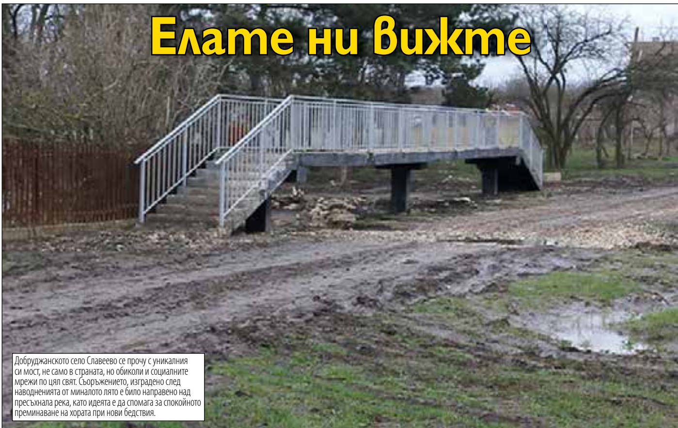
Добруджанското село Славеево се прочу с уникалния си мост, не само в страната, но обиколи и социалните мрежи по цял свят. Съоръжението, изградено след наводненията от миналото лято е било направено над пресъхнала река, като идеята е да спомага за спокойното преминаване на хората при нови бедствия.