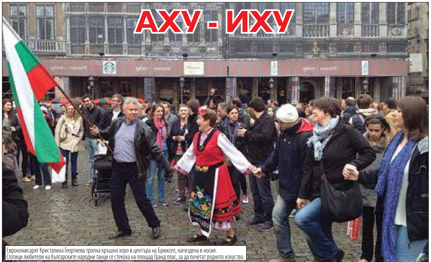
Еврокомисарят Кристилина Георгиева тропна кръшно хоро в центъра на Брюксел, нагиздена в носия. Стотици любители на българските народни танци се стекоха на площад Гранд плас, за да почетат родното изкуство.