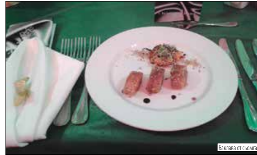
Баклава от съомга

Друзья е новото име на старо място – ресторанта на Дома на съветската наука и култура, както се наричаше дълго време каменното здание на ул. Шунка. То си е цял комплекс на три нива, най-горното от които е култарното. С три стъклени стени, които се отварят, странно е защо тук дават да се пуши. Но