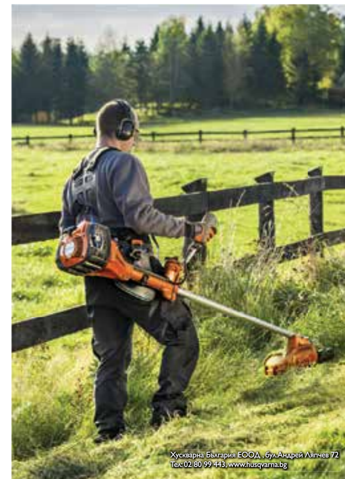
Хускварна България ЕООД, бул. Андрей Ляпчев 72 Тел: 02 80 99 443, www.husqvarna.bg