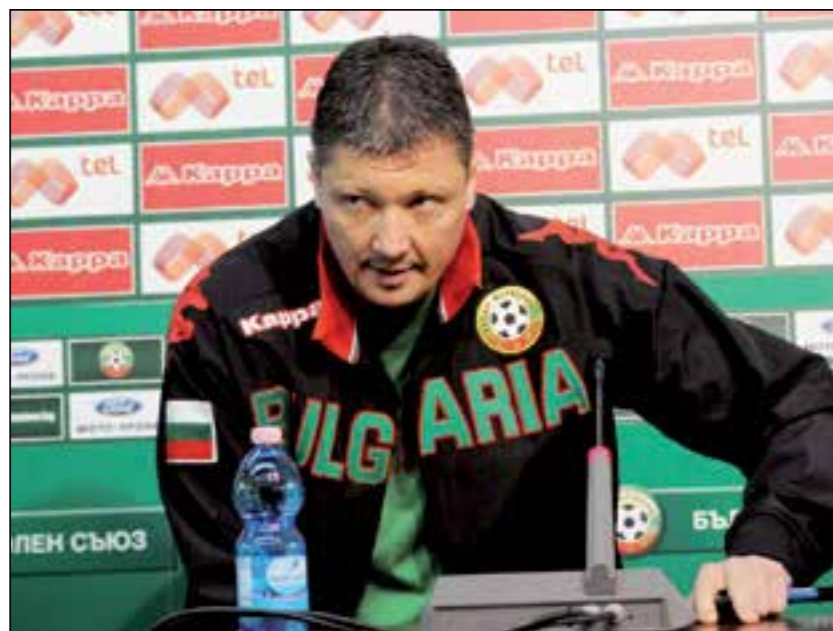
Ел Голеадор ще води отбора до края на сезона

По данни до края на сезона бившият национален селекционер се е съгласил да работи на Армията без пари. Пенев се нагърби със задачата да вдигне на крака поваления гранд, който все още няма победа