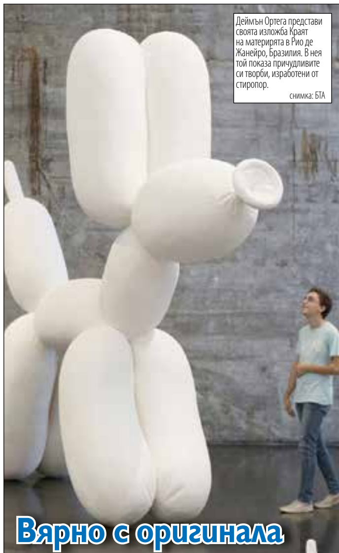
Деймън Ортега представи своята изложба Краят на материята в Рио де Жанейро, Бразилия. В нея той показва причудливите си творби, изработени от стиропор.