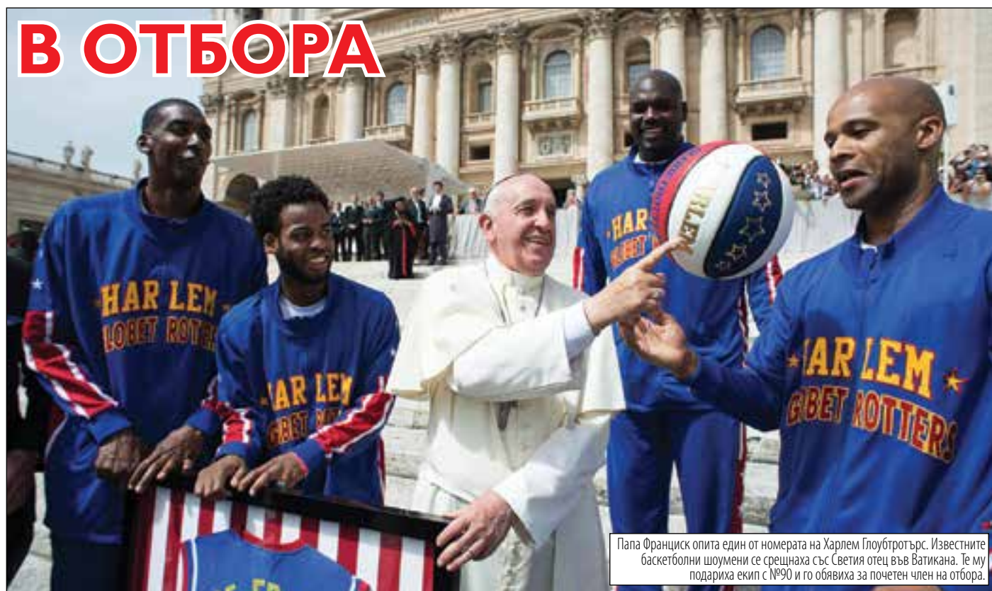
Папа Франциск опита един от номерата на Харлем Глоубротърс. Известните баскетболни шоумени се срещнаха със Светия отец във Ватикана. Те му подариха екип с №90 и го обявиха за почетен член на отбора.