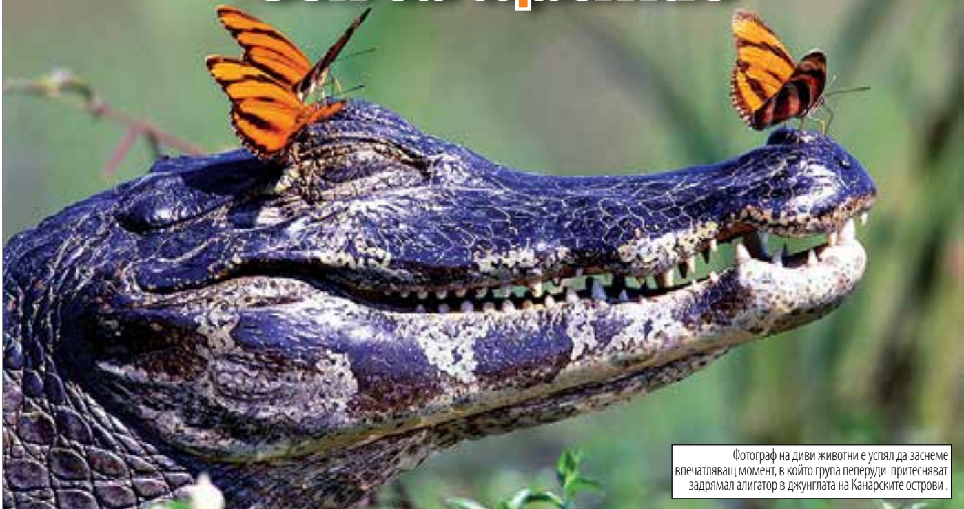
Фотограф на диви животни е успял да заснеме впечатляващ момент, в който група пеперуди притесняват задрямал алигатор в джунглата на Канарските острови.