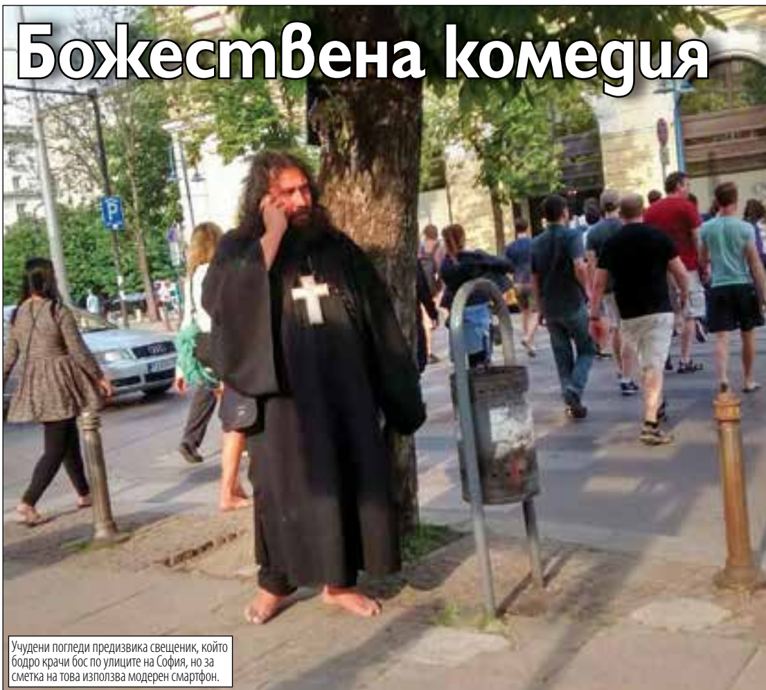
Учудени погледи предизвика свещеник, който бодро крачи бос по улиците на София, но за сметка на това използва модерен смартфон.