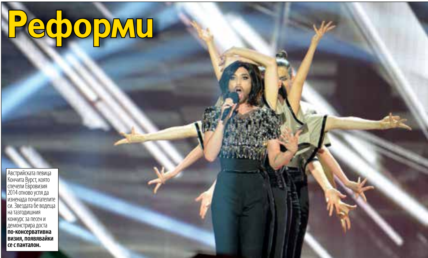
Австрийската певица Кончита Вурст, която спечели Евровизия 2014 отново успя да изненада почитателите си. Звездата бе водеща на тазгодишния конкурс за песен и демонстрира доста по-консервативна визия, появявайки се с панталон.