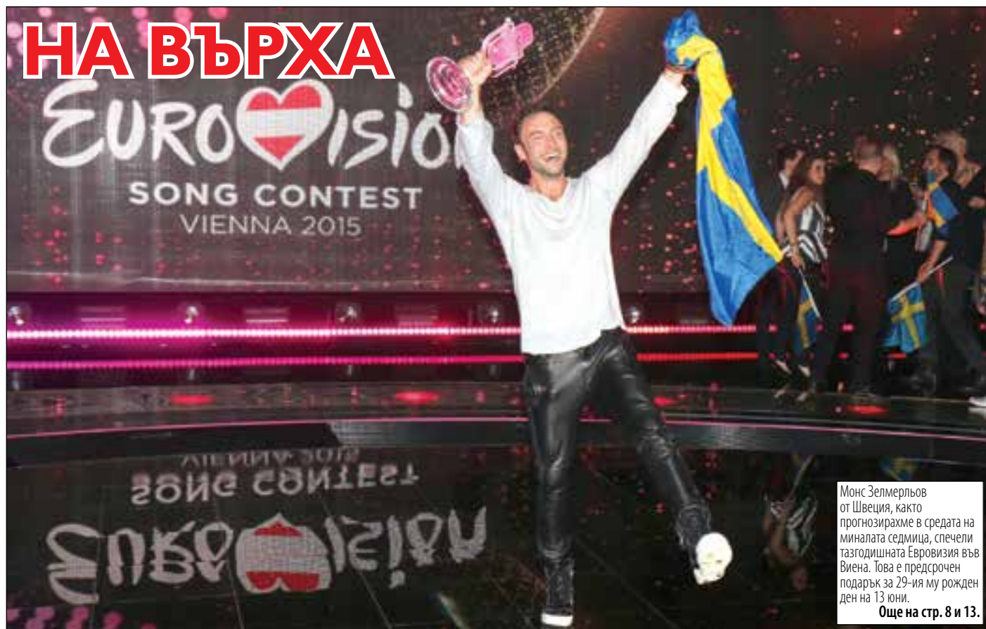
Монс Зелмерльов от Швеция, както прогнозирахме в средата на миналата седмица, спечели тазгодишната Евровизия във Виена. Това е предсрочен подарък за 29-ия му рожден ден на 13 юни. Още на стр. 8 и 13.

>>В ДЪРЖАВНИТЕ ИНСТИТУЦИИ „ЦАРИ НИХИЛИЗЪМ“, ЗАЯВИ ТОДОР ТАНЕВ, ОБРАЗОВАНИЕТО В СТРАНА, КЪДЕТО ПОЛОВИНАТА ДЕЦА ИЗЛИЗАТ ОТ УЧИЛИЩЕ НЕГРАМОТНИ БИЛО „НА НИВО“ БЪЛГАРИЯ.cmp.2