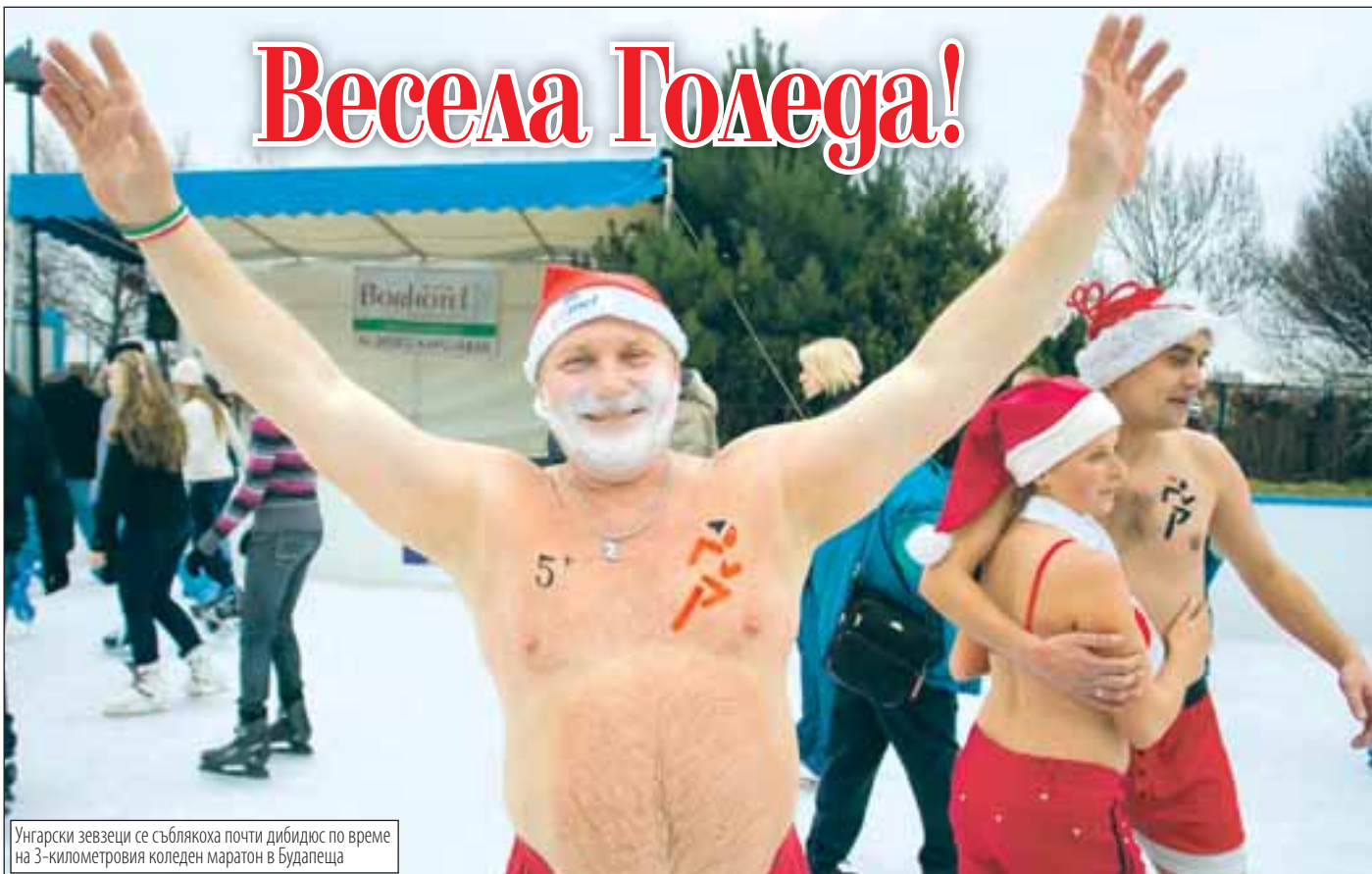
Унгарски зевзеци се съблякоха почти дибидиос по време на 3-километровия коледен марафон в Будапеща