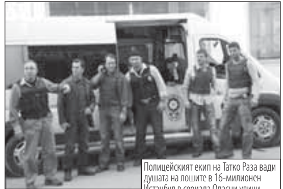
Полицейският екип на Татко Раза вади душата на лошите в 16-милионен Истанбул в сериала Опасни улици

Други хитови сериали, любими на българските зрители, са пионерите 1001 нощи, Мелодия на сърцето и Гордата Аси, сега погледите събират Златната клетка, Малки тайни, Мечтатели и Двама завинаги. Хит са и две криминалета – култовият Арка Сокаклар (Опасни улици), който разказва за живота на екипа на Татко Раза в централното полицейско управление на мегаполиса Истанбул,