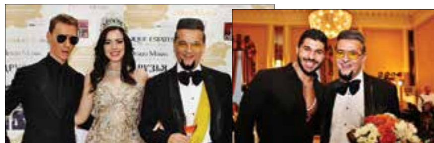
Фики пя в чест на Евгени

е модел, а след това и с Джейсън Браг Люис.