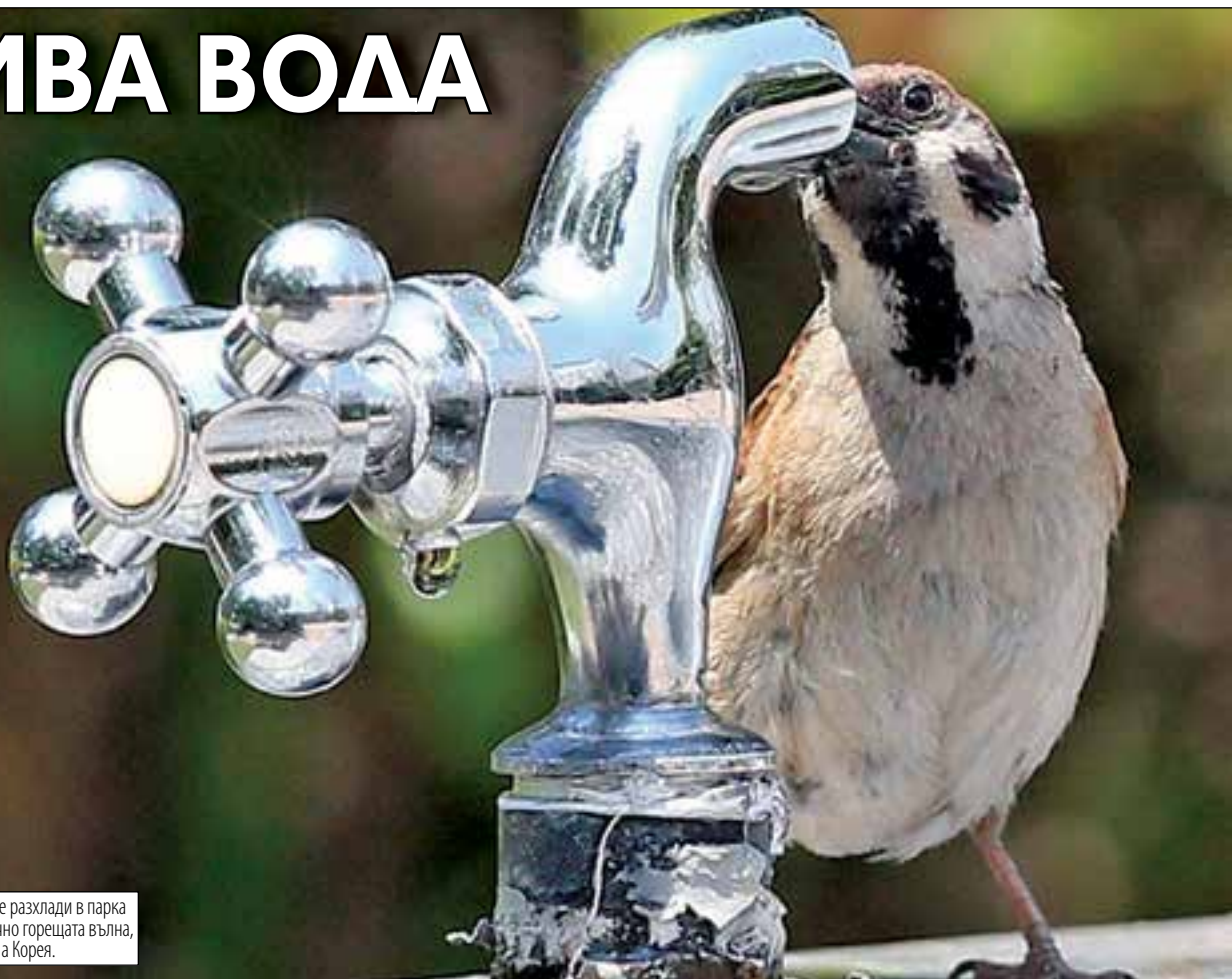
Врабче се опитва да се разхлади в парка в Суwon, след нетипично горещата вълна, преминала през Южна Корея.