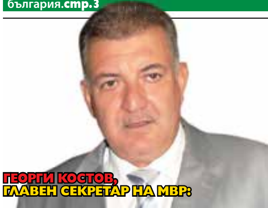
ГЕОРГИ КОСТОВ, ГЛАВЕН СЕКРЕТАР НА МВР:

СИТУАЦИЯТА В ОРЛАНДОВЦИ Е ИНТЕЛЕКТУАЛНО ПРЕДИЗВИКАТЕЛСТВО