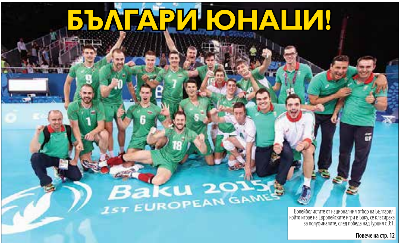
Волейболистите от националния отбор на България, който играе на Европейските игри в Баку, се класираха за полуфиналите, след победа над Турция с 3:1.