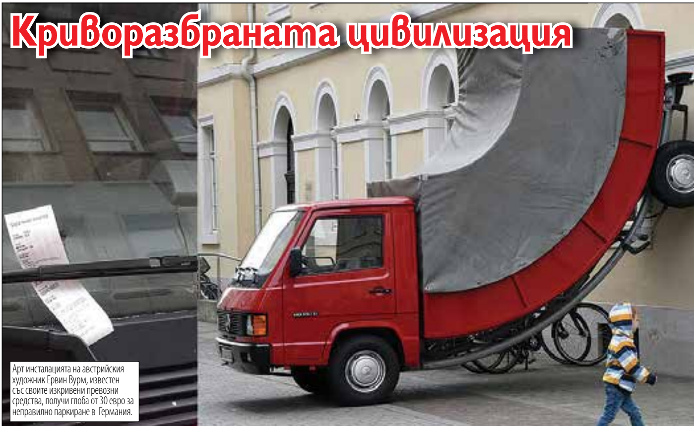
Арт инсталацията на австрийския художник Ервин Вурм, известен със своите изкривени превозни средства, получи глоба от 30 евро за неправилно паркиране в Германия.