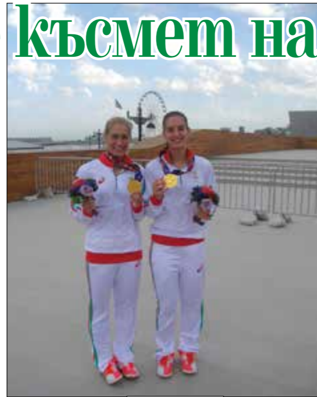
Новите златни момичета...

уви, останаха сребърни срещу Германия. По-важното е, че 19 минути е първата българска медия не просто със специален участък на игри, но и с участник. Предста-