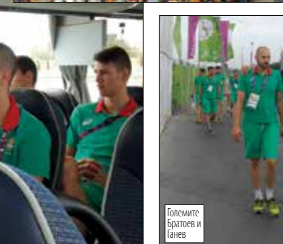
Големите Братоев и Ганев