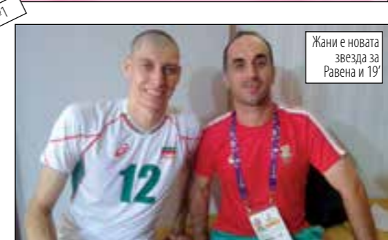
Жани е новата звезда за Равена и 19'