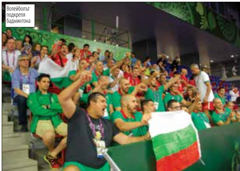
Волейболът подкрепя бадминтона