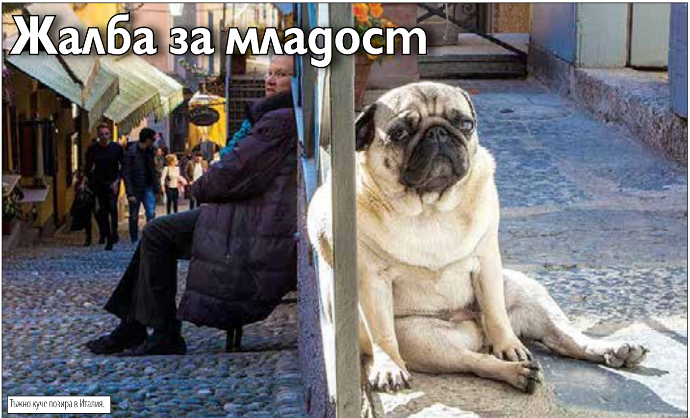
Тъжно куче позира в Италия.